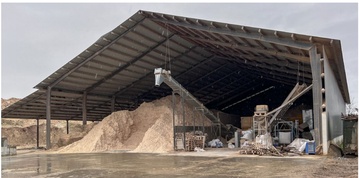
Anläggningen hos North Trade House.